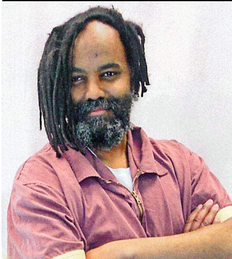
مومیا ابوجمال (امریکایی)، د ۱۹۹۴ کال دسمبر

بگذریم از اینکه سطح کارگران بیکار بیش از پیش افزایش یافته است و این خود سطح استثمار طبقه کارگر را بالا برده است. در حال حاضر کارگران کشور ما، ارزان ترین نیروی کار در کشورهای منطقه به شمار می رود.